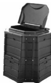
Modèle plastique 400 litres