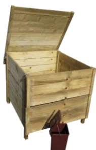
Modèle bois 575 litres